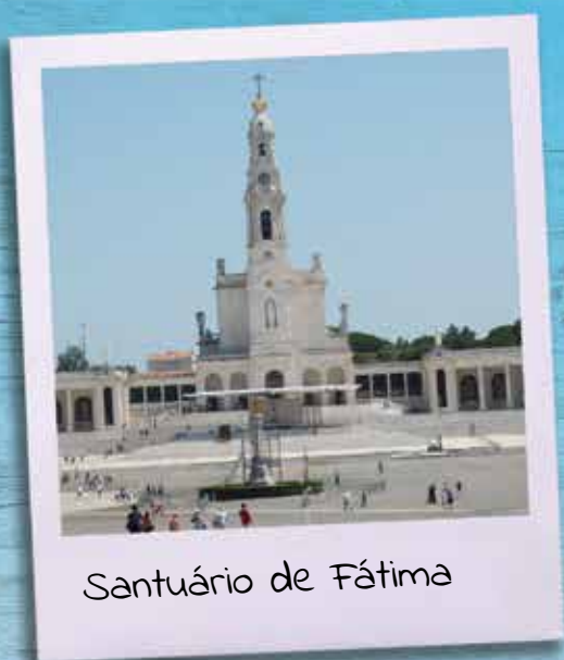
Santuário de Fátima