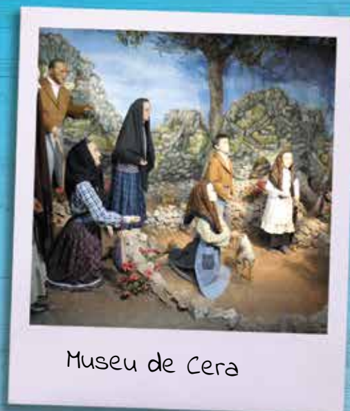
Museu de Cera