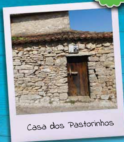
Casa dos Pastorinhos

Partimos em direcção à aldeia de Aljustrel onde podemos conhecer as origens dos três Pastorinhos de Fátima: Lúcia, Jacinta e Francisco, através da visita às suas casas onde iremos ver no terreno os espaços reais retratados aquando da visita ao Museu de cera. Regresso.