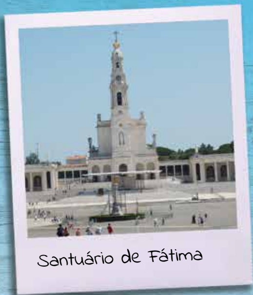
Santuário de Fátima