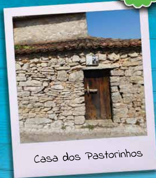
Casa dos Pastorinhos

Visitamos de seguida o importante local de peregrinação, o Santuário de Fátima, edificado no local onde em 1917, na Cova da Iria, se deram as aparições de Nossa Senhora aos três Pastorinhos. Visita a importantes locais como a Basílica de Nossa Senhora do Rosário de Fátima onde se encontram os túmulos dos Pastorinhos de Fátima, a Basílica da Santíssima Trindade e a Capela das Aparições. Tempo livre para práticas religiosas. Regresso.