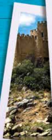
Castelo de Almourol

Terminamos a nossa visita no Santuário de Fátima, importante local de peregrinação, edificado no local onde em 1917, na Cova da Iria, se deram as aparições de Nossa Senhora aos três Pastorinhos. Visita a importantes locais como a Basílica de Nossa Senhora do Rosário de Fátima, onde se encontram os túmulos dos Pastorinhos de Fátima, a Basílica da Santíssima Trindade e a Capela das Aparições. Tempo livre para práticas religiosas. Regresso.