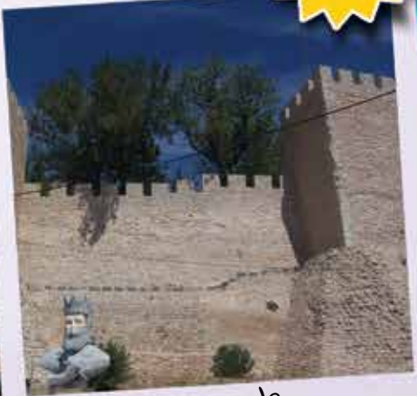
Castelo de Torres Novas