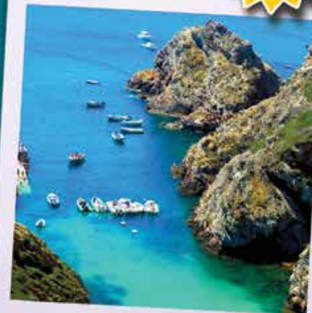
Ilha da Berlenga