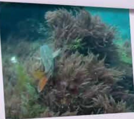
Mergulho nas Berlengas