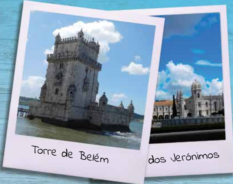
Torre de Belém