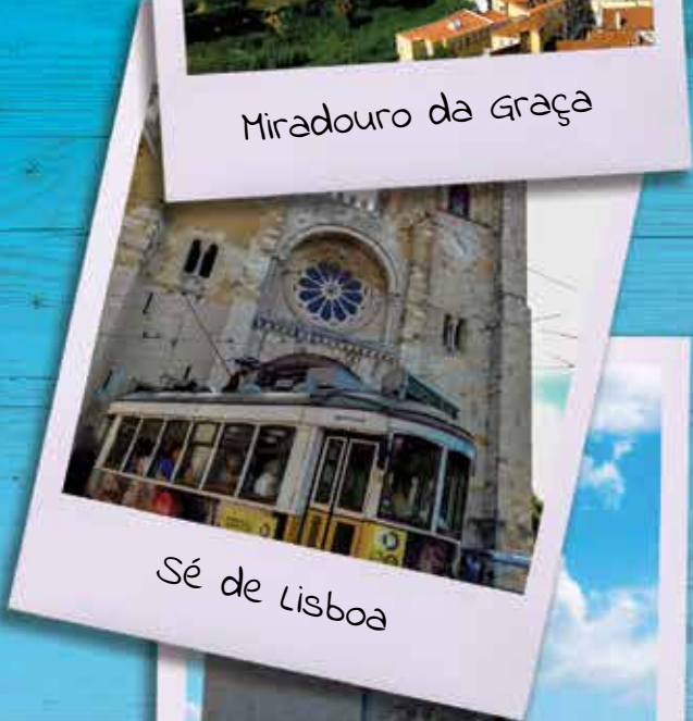
Sé de Lisboa