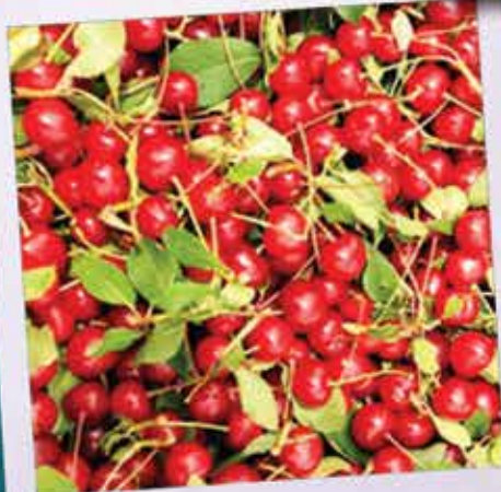
Fabrica de Ginja, Óbidos