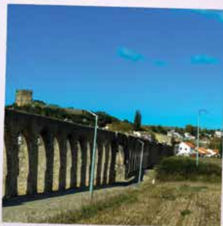
Aqueduto de Óbidos