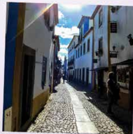
Vila de Óbidos