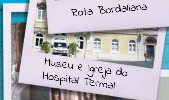
Museu e Igreja do Hospital Termal