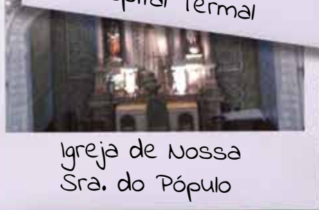
Igreja de Nossa Sra. do Pópulo