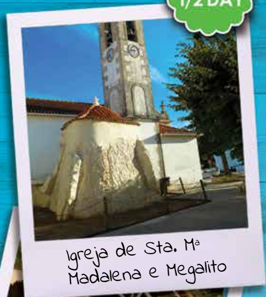
Igreja de Sta. Mª Madalena e Megalito

Deixamos Alcobertas e partimos em direcção à fonte da Bica, onde para além de termos oportunidade de descobrir o processo por detrás do fabrico do tradicional do azeite, iremos conhecer as famosas salinas, consideradas únicas no género a nível Nacional, tendo sido classificadas como Imóvel de Interesse Público desde Dezembro de 1997. Encontram-se ainda hoje em exploração, enquadradas numa pequena aldeia de ruas de pedra e casas de madeira, onde podemos encontrar uma oferta de lojas de artesanato e produtos locais. Tempo livre para compras e visita. Regresso.