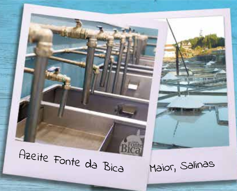
Azeite Fonte da Bica