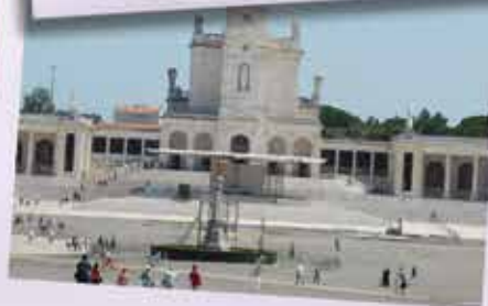
Santuário de Fátima